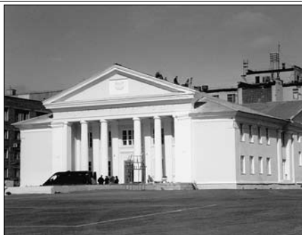
Дудинка. Дом культуры. Здесь находится общество Видергебурт.