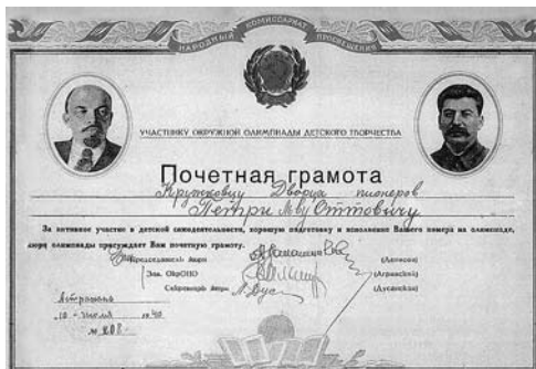
Грамота, выданная астрахананским Дворцом пионеров в 1940 г.