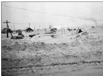
Дудинка. Зима. 1952 г.