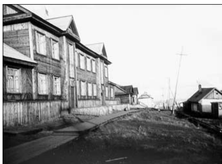
Двухэтажное здание бывшего Таймыррыбтреста (1942–1946), в плановом отделе которого я работал в 1944–1946 гг.