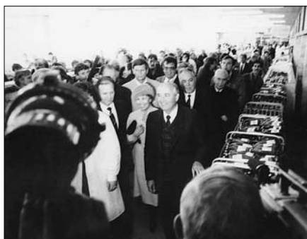
Александр Гор во время визита М.С.-Горбачева.