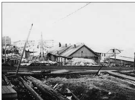
В этом бараке я жил зиму 1944/45 года в семье Роппельдт. Фото Клынтс Р. 1977 г.