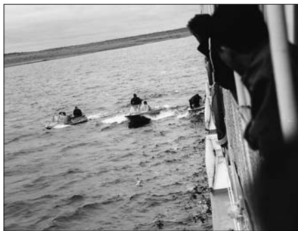
Потаповские рыбаки пытаются продать улов рыбы пассажирам и команде теплохода. Июль 2002-г.