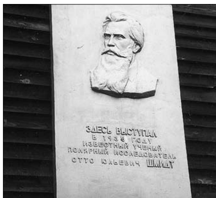
Мемориальная доска известному ученому, начальнику Главсевморпути О.Ю. Шмидту. Июль 2002-г.