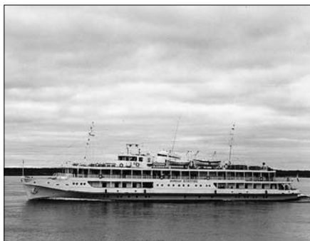
Наш теплоход «Профессор Близнюк» в рейсе Красноярск – Дудинка: 3 дня вниз по течению, 7 дней – вверх.