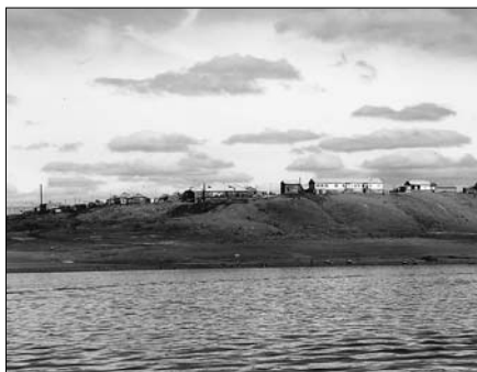
Здесь в сентябре 1942 года с теплохода «Иосиф Сталин» высадили семью Вальтер. Зимовали в оленьей конюшне. Из 1500 завезенных в 1942 году к 1945 году в живых осталось только 400 человек. Сейчас население Потапово 400 человек.