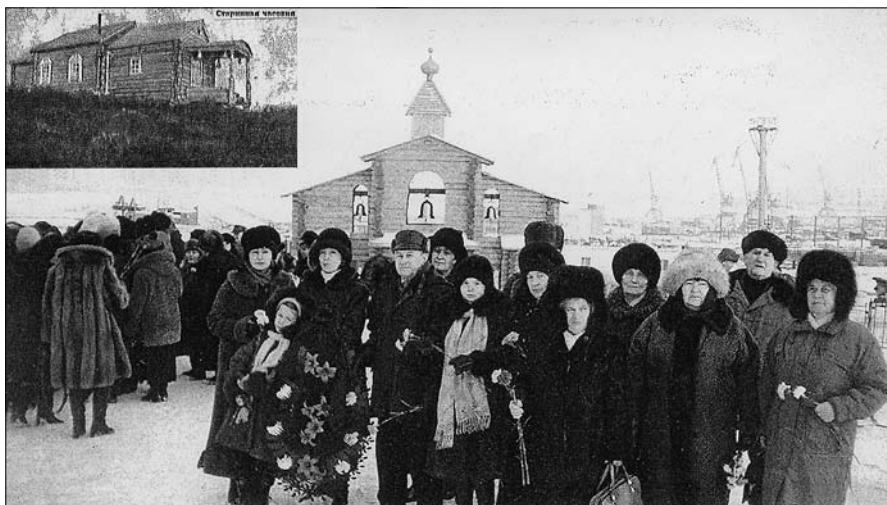
На горе Шмитиха построена часовня-памятник. С этого места в 1935 году началось промышленное освоение месторождений Норильска: руками заключенных начали добывать уголь. В день памяти жертвам политических репрессий 1935–1955. Норильск, 28.10.2001 г.