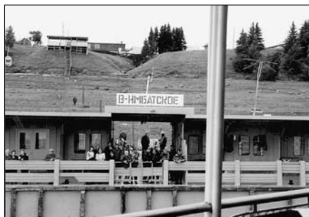
Местное население живет за счет работы на лесозаготовках. Фото Петри Л. Июль 2002 г.