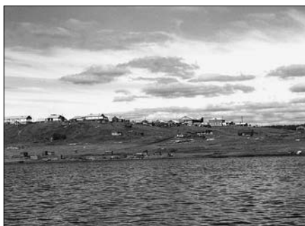
Потапово. Население 400 человек. За 1942–1945 гг. погибло 1100 человек.