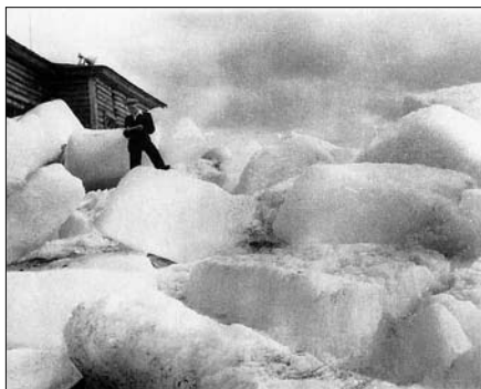
Швиндт Роберт. Порт Дудинка после ледохода. 1956 г.