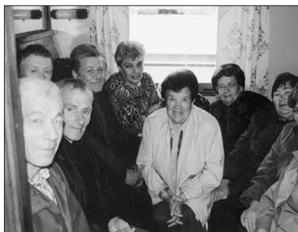
В каюте первого класса теплохода «Ипполитов-Иванов» собрались с напутствием счастливого обратного рейса. 2002 г.