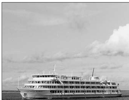
Современный флагман «Антон Чехов».