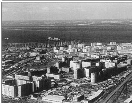
Современная Дудинка. Видны портные краны, Енисей и остров. Ширина реки – 12 км. В 2002 году в Дудинке проживало 150 бывших репрессированных, всего на Таймыре – 190 немцев.