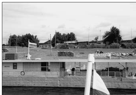
Местные жители заготавливают дрова за счет аварийного леса с Ангары. Июль 2002 г.