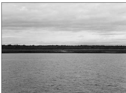
Здесь в 1942–1944 годах 500-метровым неводом высотой 8 метров в две смены (с начала июня по 5–10 октября) добывали рыбу для фронта.