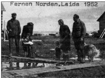
Условия жизни и работы спецпоселенцев на Крайнем Севере в 40-60-е годы. Лайда, 1948, 1952 г.