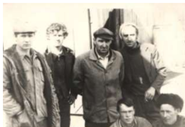
На фото 80-е года агроном и механизаторы.