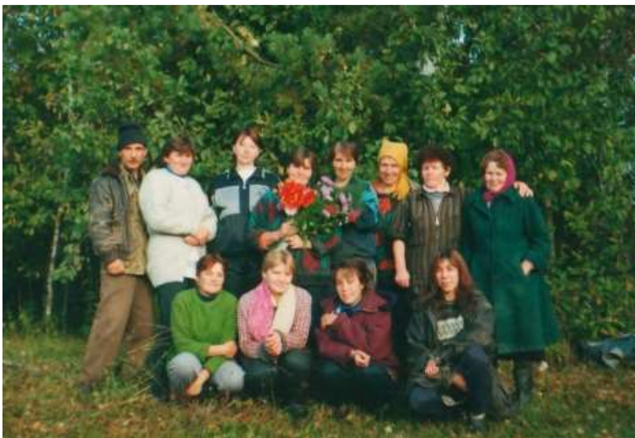
На фото: Скотники и доярки 90-е года.