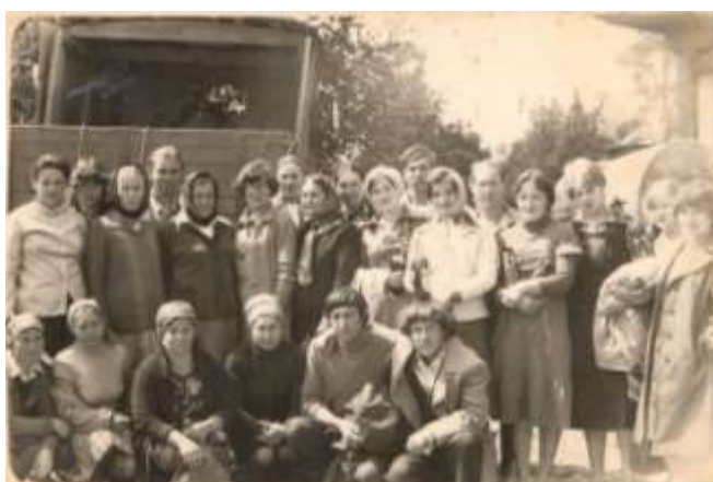
На фото 80-е года скотники и доярки колхоза.