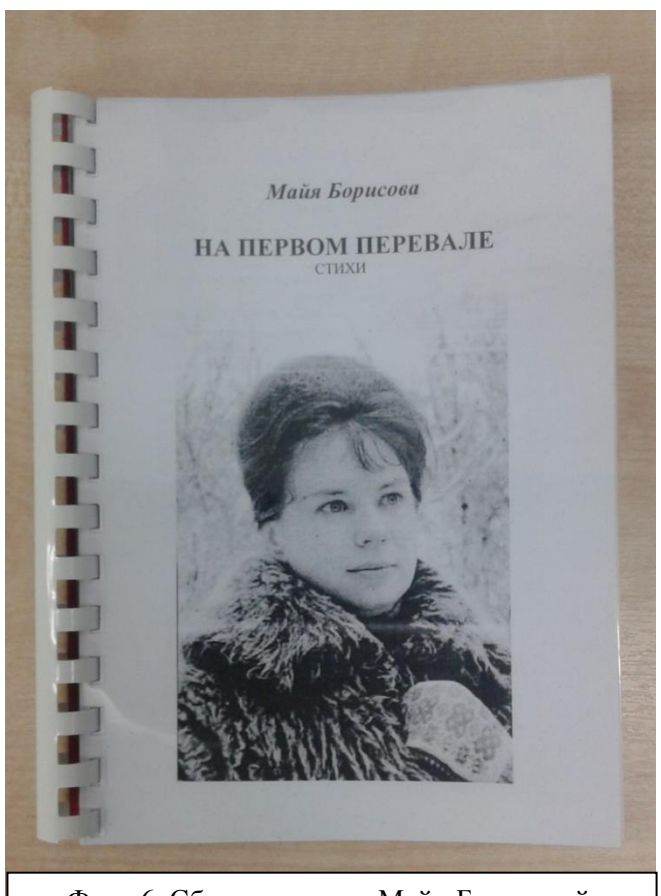
Фото 6. Сборник стихов Майи Борисовой, переизданный нами

Мы не будем выступать «строгими критиками», не эта цель нашей работы, мы только отметим, что нам, современным читателям, некоторые стихи покажутся уж слишком простыми, наивными, в некоторых звучит излишняя патетика, риторичность, есть и не совсем удачная рифма. И все-таки, эти стихи, идущие от души, отражающие поиски и находки молодого талантливого поэта, знакомство с которыми доставляет немало радостных минут.